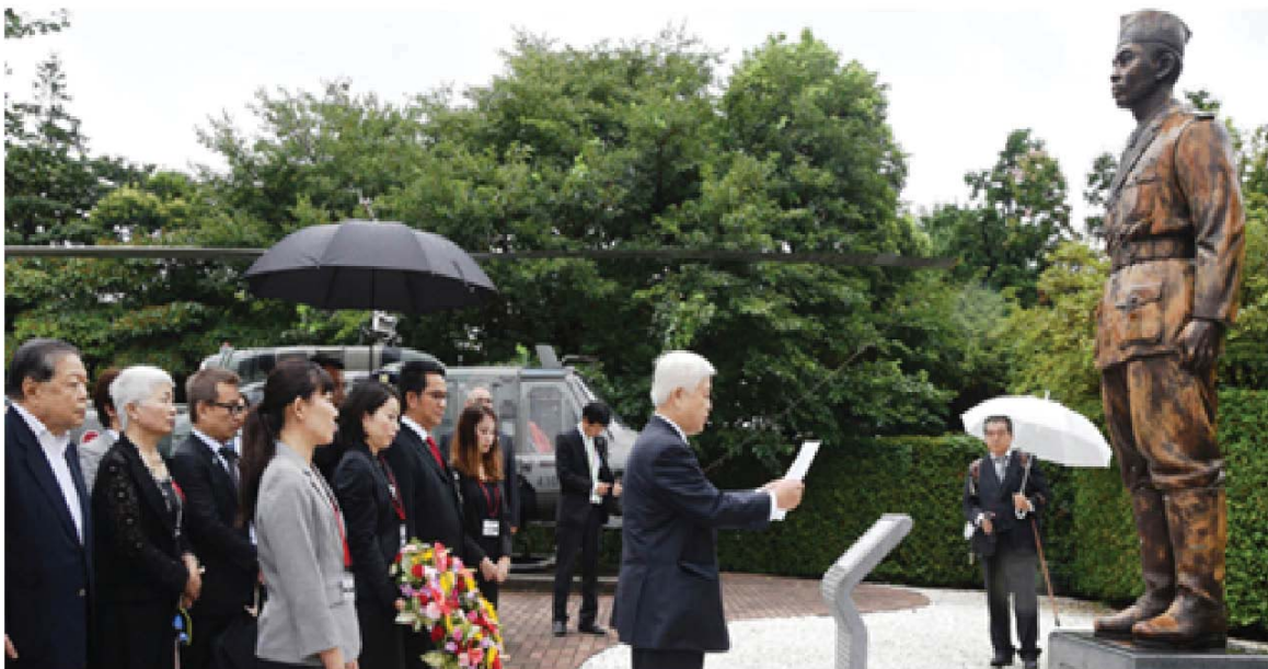
Gambar Patung Jenderal Soedirman di Jepang